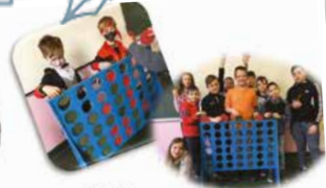
On fixe les pieds puis hop, un petit tournoi !