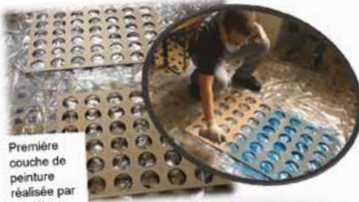
Première couche de peinture réalisée par les élèves.