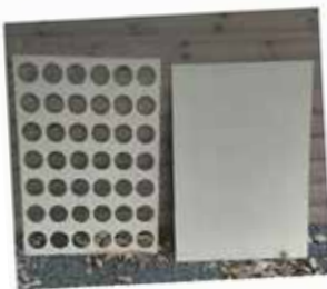
Deuxième couche de peinture.

Les plaques (tracées et trouées au préalable) arrivent à l'école.